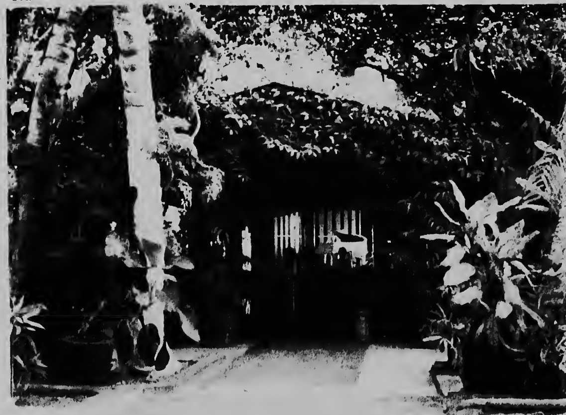
Esaki ta e entrada pa e "cocktail lounge" y "showbar". Den e parti aki e publico por sinta sabo- un cocktail y na mes momento goza di e show. Den fondo por mira e escenario cu piano.